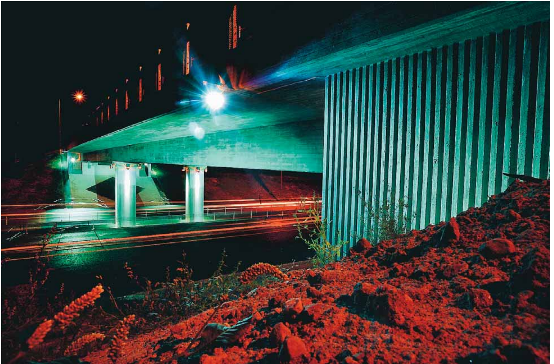
De två nya broarna vid Alster och Skattkärr har fått vacker kvällsbelysning.